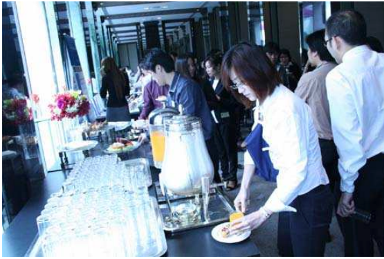
ค่าสมาชิกยังรวมสัมมนาหรือพร้อมเครื่องดื่มเครื่องเคียง-อาหารเที่ยง 2 ครั้ง/ปี

AREA เป็นศูนย์ข้อมูลที่เกี่ยวข้องตรง ไม่มีผู้มีส่วนได้ส่วนเสียใด ๆ มากล้นหรือหรือรับรู้ข้อมูลไปก่อน เพราะถือเป็นการได้เปรียบ-เสียเปรียบอย่างยิ่งทางธุรกิจ ถ้าข้อมูลที่เราทำไม่มีประโยชน์ หรือไม่ถูกต้อง ก็อาจสูญเสียความเชื่อถือจากสมาชิกเอง แต่เราไม่อยู่ใต้อาณัติขององค์กรหรือหรือคณะบุคคลใดทั้งนี้ เพื่อดำรงความเป็นกลางอย่างที่สุด